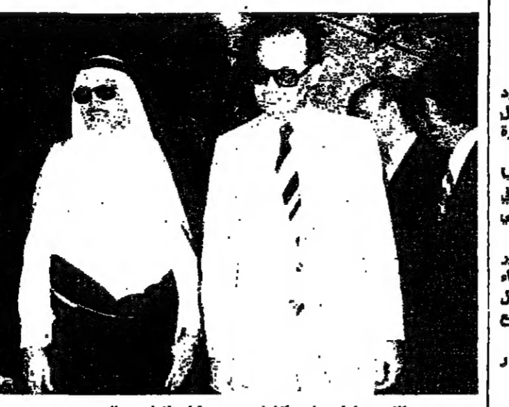
التريق اول على الشاعر يستقبل الرئيس الحص